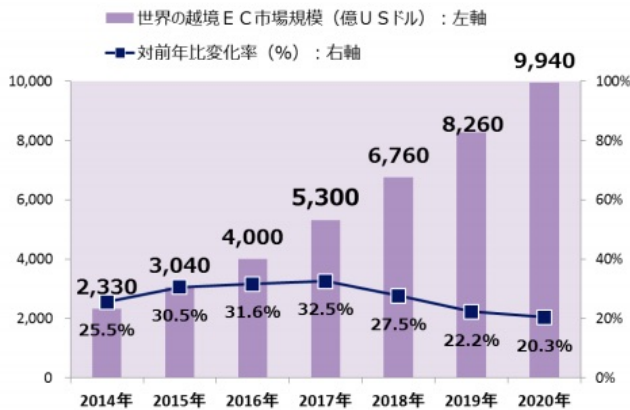
【図1】世界の越境 EC 市場規模

経済産業省の調査資料によると、越境ECの市場規模は今後も成長が見込まれ(図1)、多くのEC事業者がこれをビジネスチャンスと捉えています。一方で参入においては商品配送などの物流面を課題と感じている事業者が多く、イーベイ・ジャパンによる調査では越境ECを開始した際の課題として約60%の事業者が配送を挙げており(図2)、顧客対応や現地語への対応などを抑え最も大きな課題となっています。