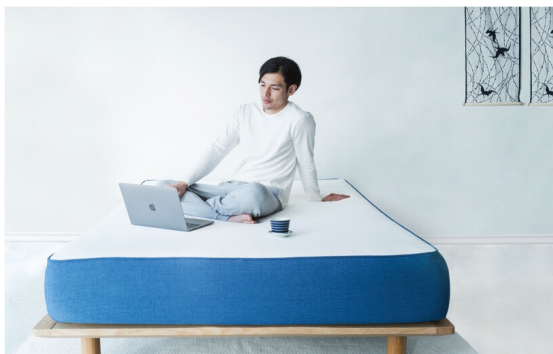
「コアラマットレス」のイメージ

弊社は、同社の日本向け輸出におけるサポートから国内倉庫の手配、越境ECプラットフォーム「Shopify(ショッピファイ)」と連携した自動出荷まで一気通貫で支援しています。