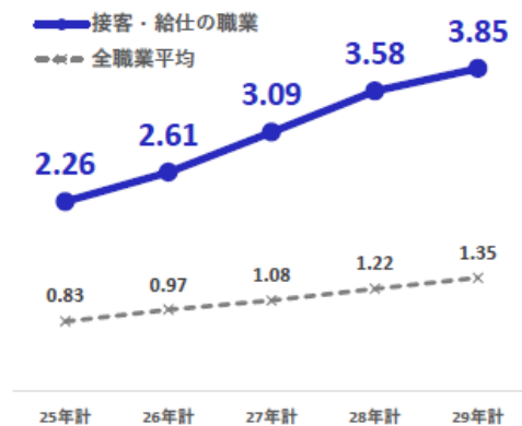
宿泊業界の有効求人倍率