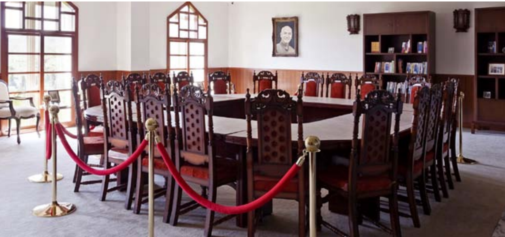
圖／蔣公書齋，華泰瑞苑 提供