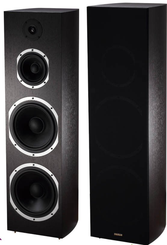
DIAGRAM D-210C 三音路落地喇叭