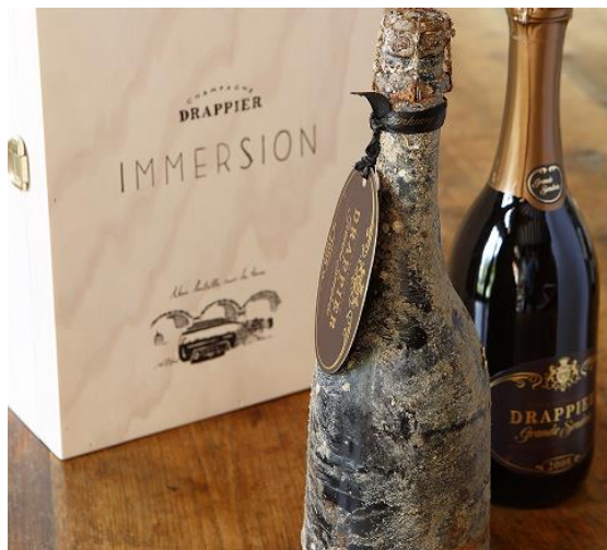
海中で熟成した為、貝殻等が付いています