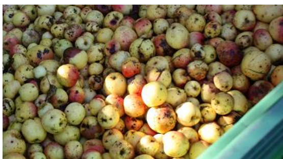
収穫後、外気にさらして更に追熟2週間

『リンゴの樹は自分の子孫を残す為の果実が完璧に熟した状態になった時に初めて、自分の樹から切り離すのだから最高の状態は枝につながっている時ではなく、枝から切り離されて地面に落ちた時なんだ。それ以前に収穫したリンゴは、まだ青く、本来持っている要素を全て出していない』