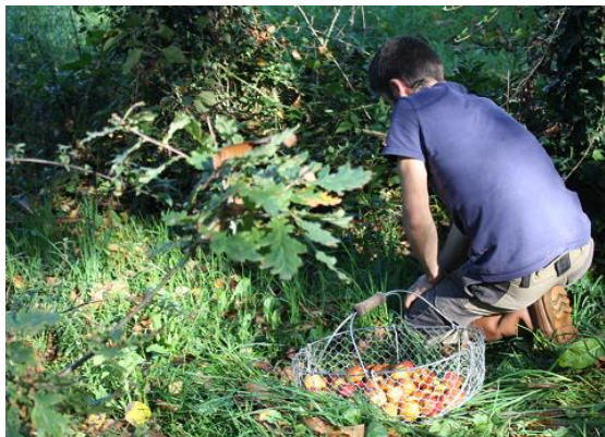
自然に落ちたリンゴのみを拾って収穫