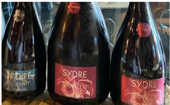
プレタノミセスは一切なし！

実家がリンゴ農家だったのでシードルに興味があり、仕入先であり、友人だった「ディディエ・ダグノー」に相談し、ナチュラルで欠陥の無いシードル造りを試し始める。最終的に、独自の压榨、発酵機を開発し、野生酵母のみでの発酵でもプレタノミセスが無い、健全なシードル造りに成功してしまいます。このシステムはエリックだけのものですので写真を撮ることも厳禁！