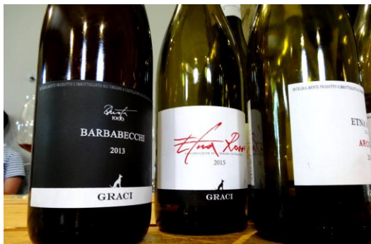
シンプルだけドイクメンエチケット

【ご注文は受注専用メール： t-order@terravert.co.jp /ファックス：03-3584-2681】