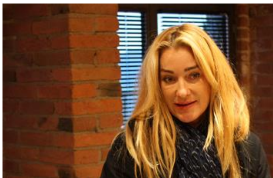
アメリカでトヨタ車の販売をしていたオーナー 引退してワイン造りの夢を叶えた