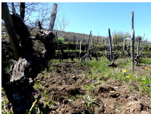
バルバベッキ！樹齢100年！火山岩テラス！

今、イタリアで最も注目を集める産地と言っても過言ではないエトナの北側斜面「パツピシャーロ」地区にグラーチはあります。ブルゴーニュのように軽やかでエレガント、伸びのある新しいタイプのエトナ。しかし、醸造はとでもクラシック！セメントタンクで長い期間をかけて発酵、その後は大樽で熟成させます。