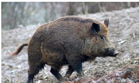
周辺の森には 100 頭以上の猪が生息している

【ご注文は受注専用メール: t-order@terravert.co.jp /ファックス:03-3584-2681】