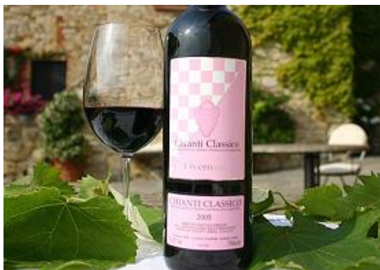
ピンクのエチケツはオーナーの趣味で…