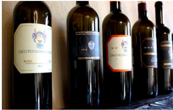
これだけで威厳や風格さえ感じられる...

【ご注文は受注専用メール: t-order@terravert.co.jp /ファックス:03-3584-2681】