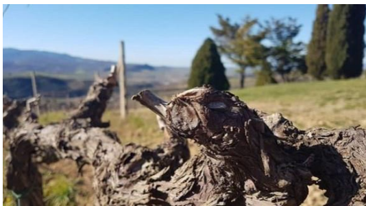
樹齢の高さと葡萄樹の生命力がピシピシ伝わります