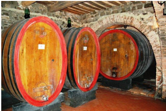
熟成はスラヴォニア産の 20-60hl の大樽

【ご注文は受注専用メール: t-order@terravert.co.jp /ファックス:03-3584-2681】