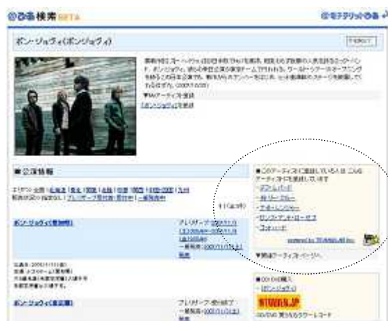
(@電子チケットぴあ アーティスト紹介ページ)

今回開始するレコメンドサービスは、お客様のお気に入りアーティストに対して嗜好性の合う別のアーティストを自動的に推奨・表示するチケット販売業界では初のサービスで、チームラボのレコメンデーション・エンジン『チームラボレコメンデーション( http://www.team-lab.com/service/technology/recommend.html )』を導入いたします。従来のレコメンドサービスは、恣意的に選ばれたものや、人気のあるものが表示されており、必ずしもお客様の嗜好性と一致するとは限らない場合もあり、情報としての価値は決して高いものではありませんでしたが、『チームラボレコメンデーション』はお客様の行動履歴を独自のアルゴリズムで計算することで、高精度なレコメンド結果を抽出・表示することを実現しました。これにより、お客様の潜在ニーズに確実に訴求できる“おすすめアーティスト”を表示できるようになります。