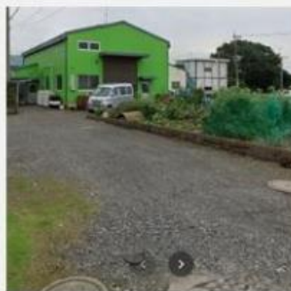
※図面と現況に相違がある場合は現況優先とします