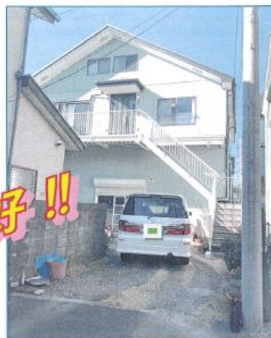
建物外観・J内観 (令和3年2月撮影)