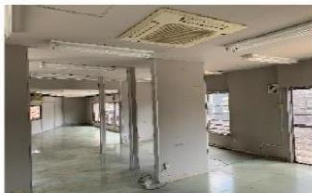
左：1F倉庫 右：2F事務所・倉庫