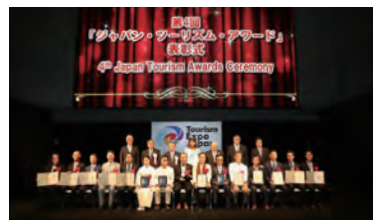
〈第4回大賞〉一般社団法人 雪国観光圏