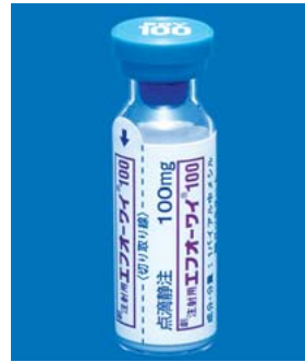
製品名を印刷した貼付ラベル

医療事故防止の視点から、注射剤については製品名を印刷した貼付ラベル（医療事故防止のために注射筒等に貼付できるラベル）を作成し、少しでも医療事故防止にお役に立てる工夫をしています。