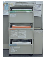
リサイクルボックス

2008年度の実績は、廃棄量78.4トン、再生に回した量64.6トンで資源化率82%になりました。