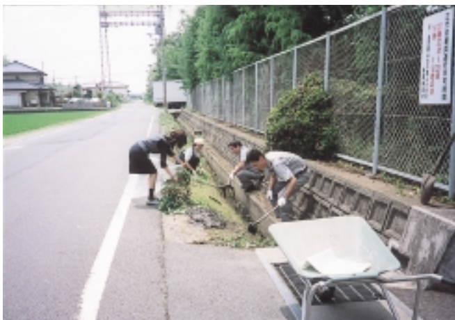
滋賀事業所正門前の溝掃除