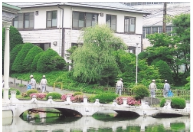
日光事業所内の清掃