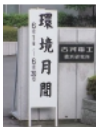
6月環境月間の立札

当社では本年度、環境保全活動に対するスローガン、環境基本方針および2001年度重点目標を盛り込んだ、全社環境保全活動のポスターを作成し、6月の環境月間に全事業所、研究所、各営業拠点に配布し、全従業員に対する環境保全活動の啓蒙を図っています。