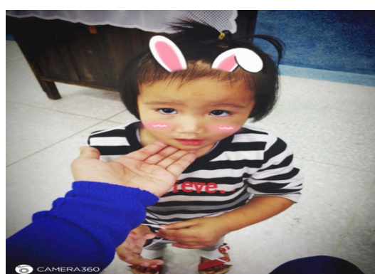
☑上主日學的第一週，來了四位小朋友，先來個變裝秀！