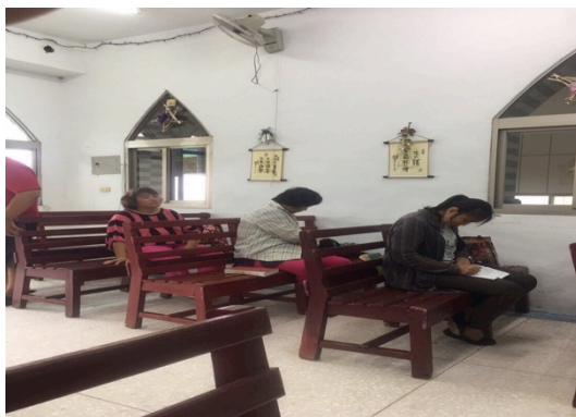
☐白天的牛門教會&等候聚會的婦女。