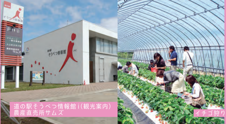
道の駅そうべつ情報館(i観光案内) 農産直売所サムズ

壮瞥りんごの町 18軒の果樹園がちななる「そうべつくだもの村」。火山の恵みを受けながら育った果物は、例年5月下旬～10月下旬までのシーズンで果物狩りも楽しめる。