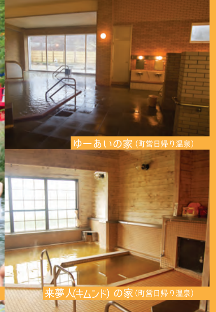
ゆーあいの家(町営日帰り温泉)