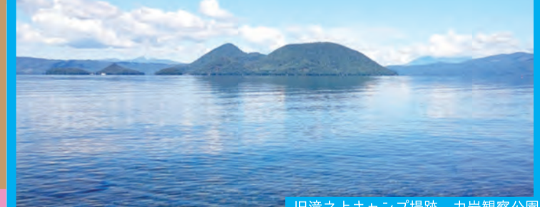
旧滝之上キャンプ場跡 カ岩観察公園

壮瞥滝 & 壮瞥川 洞爺湖から流れ出す18mのダイナミックな滝が壮瞥川に流れる。毎年5月地元の子供達がヤマメの稚魚を放流。秋になると、サケやヤマメが遡上し、運が良ければ産卵の様子を観察することもできる。