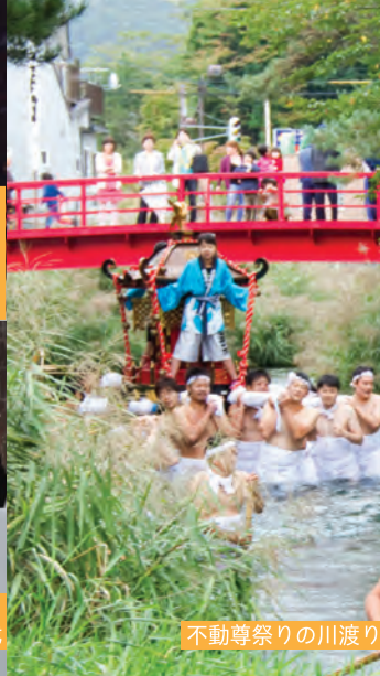
不動尊祭りの川渡り