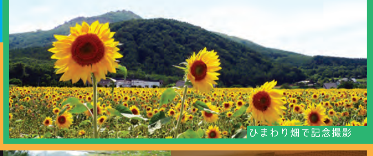
ひまわり畑で記念撮影