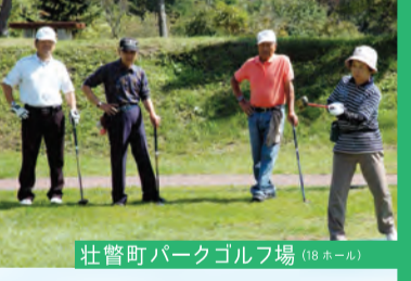
壮瞥町パークゴルフ場(18ホール)