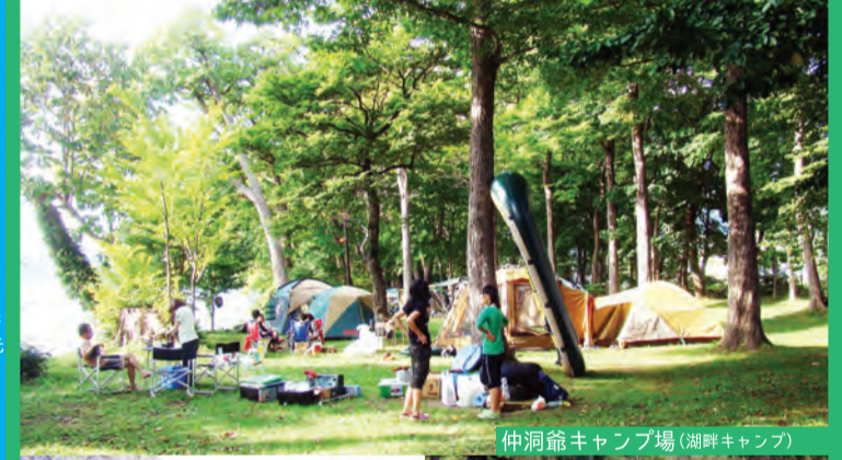
仲洞爺キャンプ場(湖畔キャンプ)