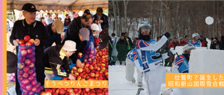
そうべつりんごまつり

横綱 北の湖記念館 壮瞥町出身、通算優勝24回の大横綱 北の湖の相撲人生をたどる展示品や様々な資料展示。