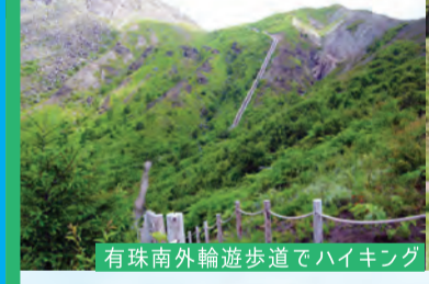
有珠南外輪遊歩道でハイキング