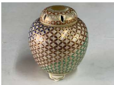
七宝 香炉 勝見 光山