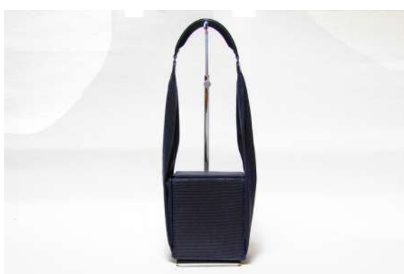
オーロラシルクレザーバッグ 生地デザイン：民谷共路 バッグデザイン：ジェロームシュミット