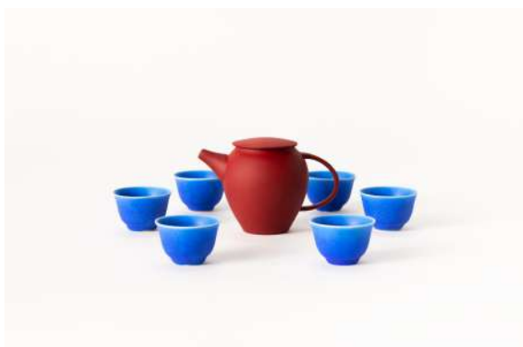
瑠璃青 玫瑰赤 茶器 近藤高弘×山田晶