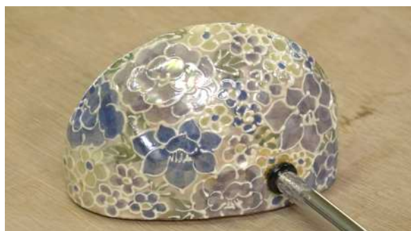
京焼パター 森俊山