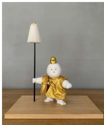
木彫御所人形「大志」 伊東庄五郎