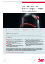
Leica ADS100 エアボーン・デジタル・センサー