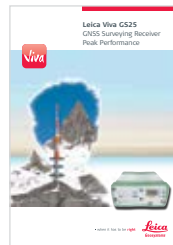
Leica Viva GS25 高精度 GNSS 受信機

イラスト、説明、技術データは変更されることがあります。無断複写・複製・転載を禁じます。 Copyright Leica Geosystems AG, Heerbrugg, Switzerland, 2015. 838020jp - 05.15 - INT