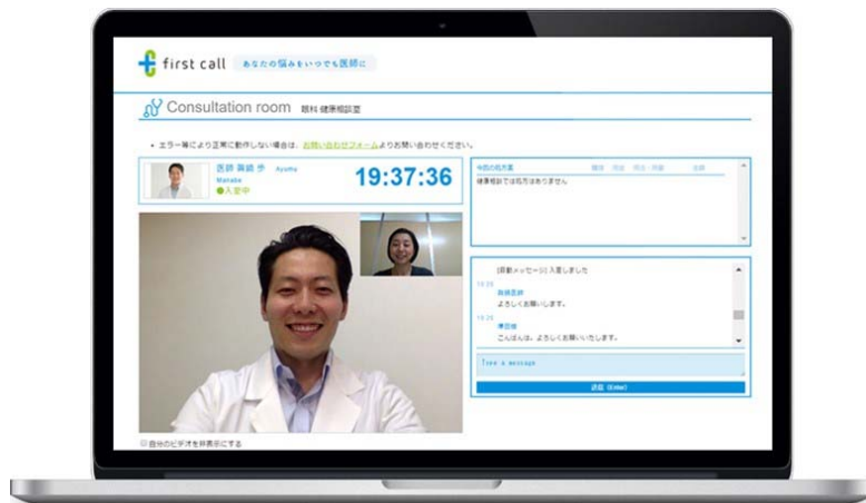
テレビ電話でじっくり相談