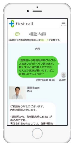
チャットで気軽に相談