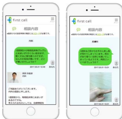
チャットで気軽に相談

「first call」は、日常生活における自身や家族の健康上の不安や悩みについて、チャットやテレビ電話で医師に相談ができるオンライン医療相談サービスです。相談科目は一般内科や小児科、産婦人科、精神科など12科目を網羅。気になる症状や疑問が生じたとき、スマホやパソコンから「first call」で疑問を投げかければ、一人ひとりの状況に合わせて医師が実名でアドバイスします。誰もがいつでも気軽に医師に直接相談できる場を提供することで、正しい医療情報の提供や適切な受診促進を行い、予防医療や医療システムの最適化に貢献することを目指しています。