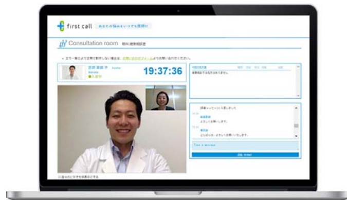
テレビ電話でじっくり相談