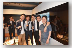
Club GPの専用サロンにて懇親会が随時開催されます

歯科雑誌やセミナーで活躍の人気講師が臨床目線で各専門分野をわかりやすく解説します。研修室に隣接しているClub GPの専用サロンにひとたび集まれば、講師陣とも縁ができて、そして同世代の仲間たちとの交流がさらに繋がること、間違いなしです。