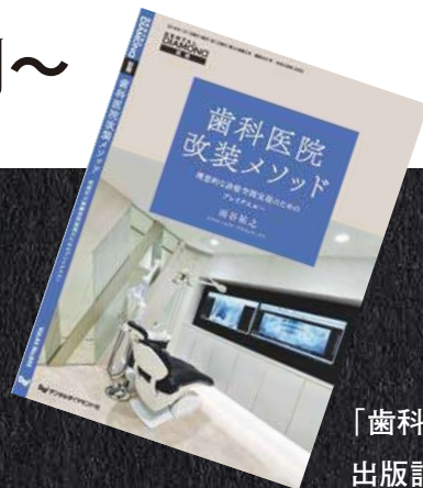
「歯科医院改装メソッド」 出版記念講演会