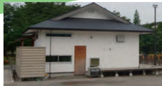
首都大学での実証実験