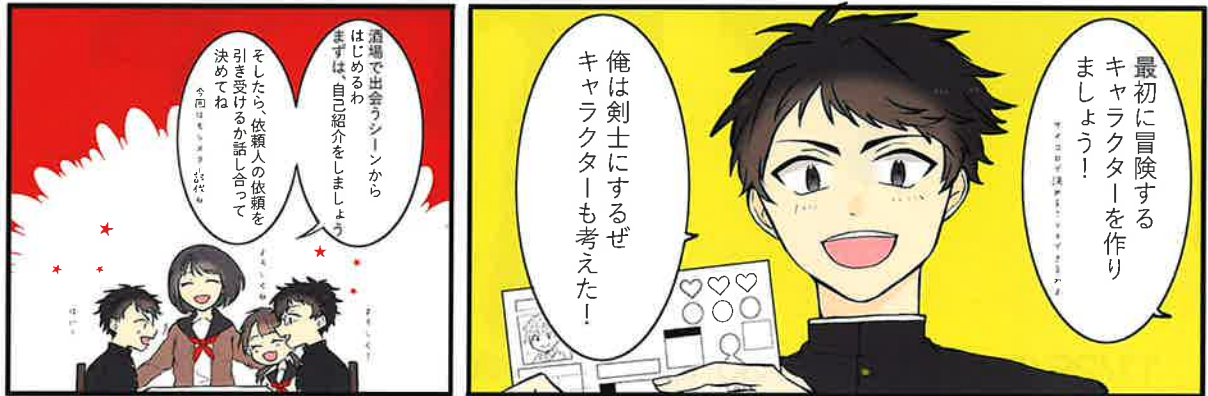
※GMはスタッフがやります。