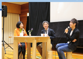
<写真:昨年度フォーラムより>