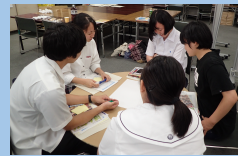
<写真:第1回企画会の様子>

※「学習会」で学んだことを活かし、地域共生フォーラム当日のプログラムを具体的につくってみませんか?