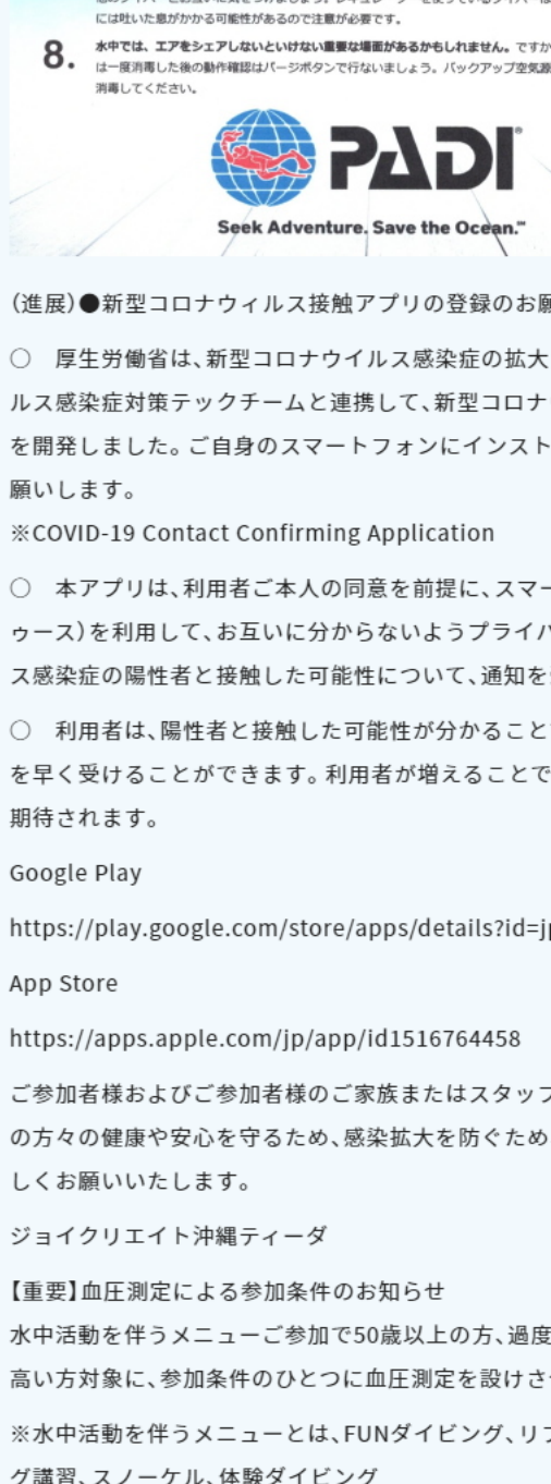
沖縄ダイビング新型コロナウイルス対策