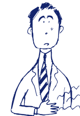
みぞおちのつかえに

体力中等度で、みぞおちがつかえた感じがあり、ときに悪心、嘔吐があり食欲不振で腹が鳴って軟便又は下痢の傾向のあるものの次の諸症 神経性胃炎、胸やけ、げっぷ、下痢・軟便、急・慢性胃腸炎、消化不良、胃下垂、胃弱、二日酔、口内炎、神経症