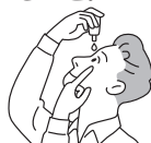
容器の先が目、まぶた、まつ毛にふれないように