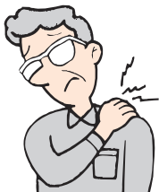
肩・首すじのこりに