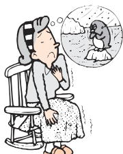
冷え、手足のしびれに