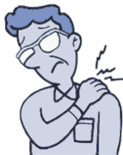
首すじ・肩のこりに