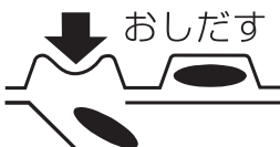
<PTPシートの取り出し図>

(誤ってPTPシートをそのまま飲み込んだりすると食道粘膜に突き刺さる等思わぬ事故につながります。)