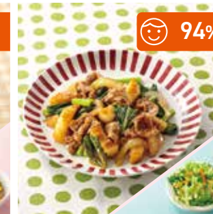
主菜 牛肉とこんがりポテトの洋風炒め 副菜 リーフサラダ