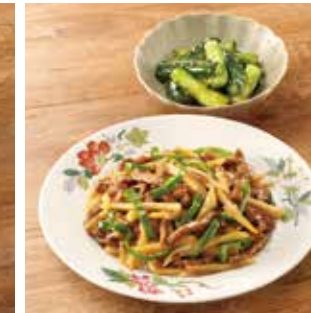
主菜 じゃが芋DE チンジャオロース 副菜1品 ごま油香るたたききゅうり