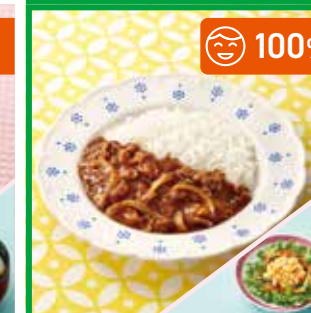
主菜 ハッシュドビーフ 副菜 炒りたまサラダ