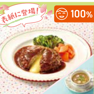
主菜 チーズインハンバーグ 副菜 ウィンナーとオニオンのスープ