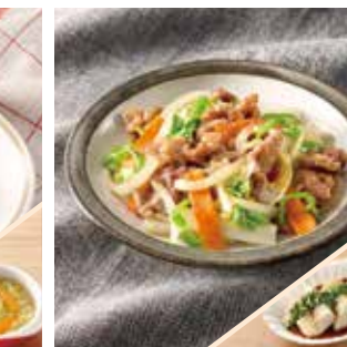
主菜 豚肉と白菜のみそ炒め 副菜 豆腐のニラ醤油かけ