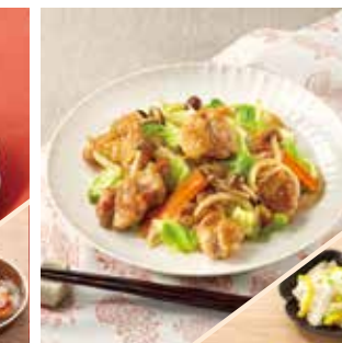
主菜 鶏肉と野菜のオイスターソース炒め 副菜 3色野菜の甘酢漬