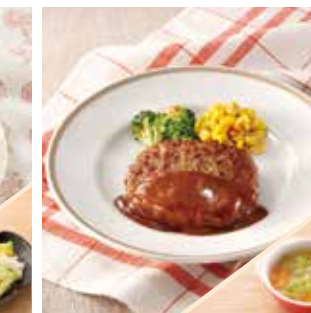
主菜 ハンバーグデミソース 副菜 野菜スープ