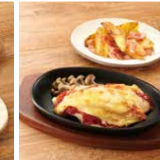
主菜 カレイのチーズ焼き 副菜1品 ジャーマンポテト