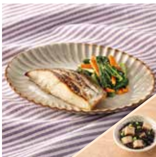
主菜 銀ひらす昆布白醤油焼き 副菜 ひじきと高野豆腐の煮物