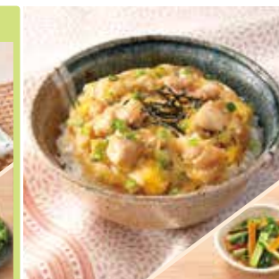
主菜 レンジで簡単! 外食の味 親子丼 副菜 ほうれん草のおひたし ※小松菜をほうれん草に替えてお届けします。