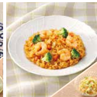
主菜 ぶりぶりえびの簡単カレーピラフ 副菜 コールスローサラダ