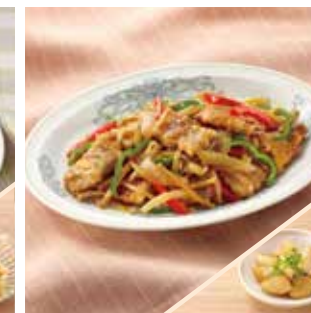
主菜 豚肉の中華炒め 副菜 大根のべっこう煮