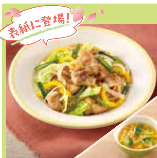
主菜 鶏肉とキャベツのレモンソース炒め 副菜 ブロッコリーとコーンのスープ