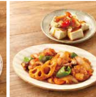
主菜 たっぶり野菜の酢鶏 副菜1品 韓国風冷奴