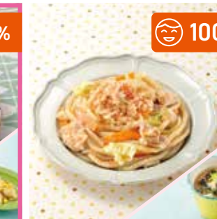
主菜 鶏ちゃん焼きうどん 副菜 海苔とねぎのスープ