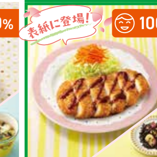
主菜 やわらかとんかつ 副菜 さつま芋ひじき