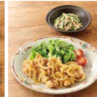
主菜 豚肉の生姜焼き 副菜1品 チンゲン菜とえのきのおかかマヨ和え