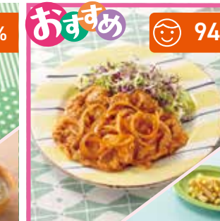
主菜 食欲そそる! ポークチャップ 副菜 ポテトとコーンのバター醤油炒め