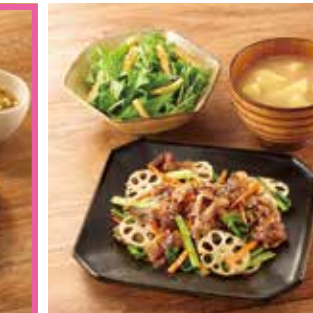
主菜 牛肉とれんこんの金平 副菜2品 ●水菜と油揚げのサラダ ●じゃが芋のみそ汁