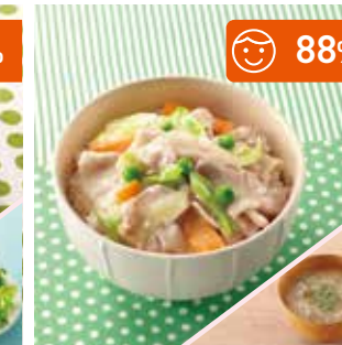
主菜 中華丼 副菜 ごぼうのみそ汁