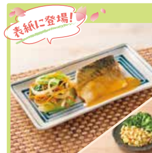
主菜 お手軽♪さばのみそ煮 副菜 シェルマカロニサラダ