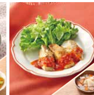
主菜 たらのムニエル トマトソース 副菜 大根とウィンナーのコンソメ煮