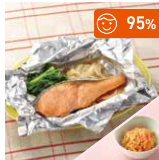
主菜 北海道産 鮭のホイル焼き 副菜 大根と人参のごま金平