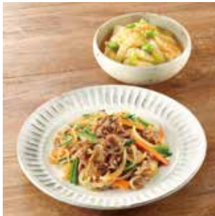
主菜 牛肉のチャプチェ風 副菜1品 あんかけ豆腐