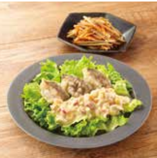
主菜 たらのから揚げ タルタルソース 副菜1品 金平ごぼう