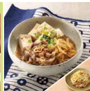
主菜 肉豆腐 副菜 きゅうりと大根のうま塩ナムル