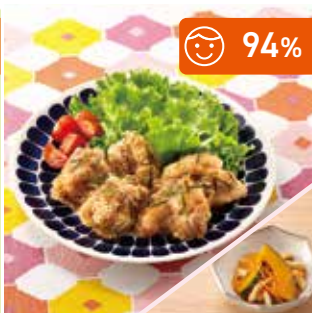
主菜 のりと胡麻の揚げない唐揚げ 副菜 かぼちゃとお揚げの煮物