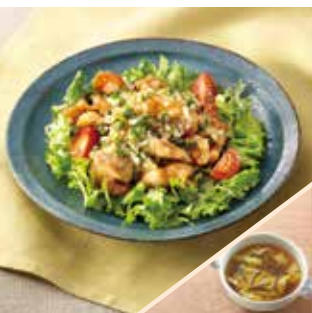
主菜 特製だれの油淋鶏 副菜 白菜ときくらげの中華スープ