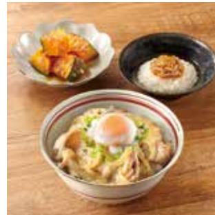
主菜 とろ〜り温玉豚丼 副菜2品 ●かぼちゃのおかか煮 ●なめたけおろし