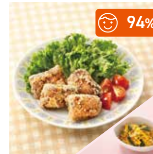
主菜 骨まで食べられる♪ いわしの竜田揚げ 副菜 かぼちゃごまマヨ和え