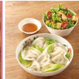
主菜 特製ダレで食べる ぶるもち水餃子 副菜1品 レタスの韓国風厚揚げのつけ