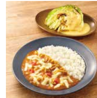
主菜 コク旨! トマトチーズカレー 副菜1品 焼きキャベツサラダ