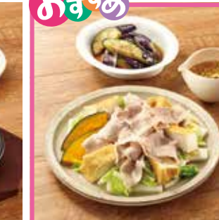
主菜 簡単! 豚肉のレンジ蒸し 副菜1品 なすの揚げびたし