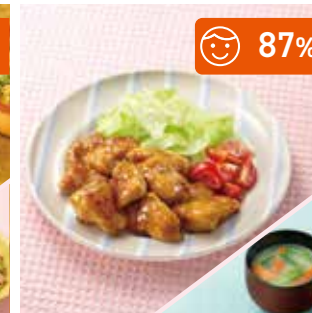
主菜 甘辛照り焼きチキン 副菜 小松菜のみそ汁