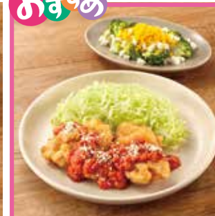
主菜 手づくりチキンカツ トマトソース 副菜1品 ブロッコリーのみもザサラダ