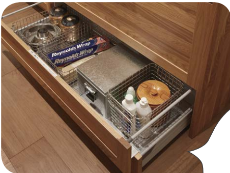
アンダーストッカー(耐荷重15kg) キッチンまわりのお掃除用品や、ゴミ袋、キッチンペーパー、洗剤といった買い置き品の収納にぴったりです。