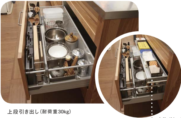
上段引き出し(耐荷重30kg) シンクまわりでよく使うザルやボウルなどを収納できます。