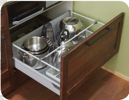
上段引き出し (耐荷重15kg)