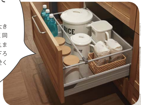
中段引き出し (耐荷重15kg)

調味料や粉もののパッケージは、大きさもデザインもバラバラ。なるべく同じ容器に詰め替えて見た目をそろえましょう。引き出し収納は上から見下ろすので、フタに中身のシールを可愛く貼っておくといいかも!