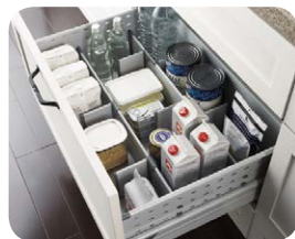
ボックスサイド収納パーツ 収納物を分類しやすく、混在を防ぐ板状の仕切りパーツ。調理キャビネットや加熱調理機器用キャビネットに取り付けできます。