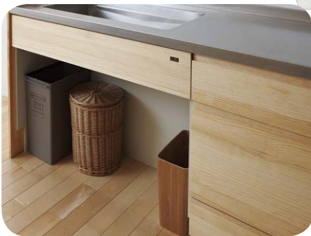
シンク下オープンキャビネット オープンタイプのキャビネットを選べば、生活感が出てしまう 分別ゴミ箱もすっきり隠しておけます。