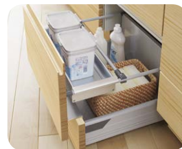
アルミトレイ 引き出しの枠に渡して、背の低い調味料などを収納できます。アンダーストッカー一部にも取り付け可能。洗剤やスポンジ、タワシなどのストック品の収納にも便利です。