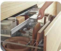
インナー引き出し付き キャビネット シンクキャビネットの上段引き出しを、より有効活用できるインナー引き出し付きのキャビネットをご用意しています。