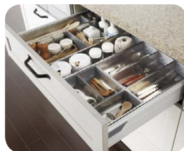
ステンレストレイセット 調理キャビネットの上段におすすめ。カトラリー類などを分けて収納できる、高品質なステンレス製トレイです。食器洗い乾燥機で洗えます。