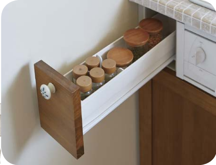
小引き出し (耐荷重5kg)