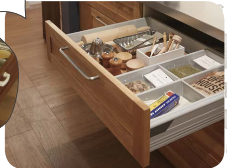
上段引き出し (耐荷重20kg)