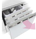
ラクドア 取手を握ると自動的にドアが押し出され、小さな力ですーっと引き出せます。

軽い力でラクに引き出せるラクドア シャワーミストで汚れを浮かせてはがす センサーで見分けて洗うおまかせエコ