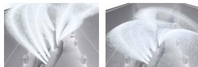
ターボ噴射 スポット(上かごを中心に) ターボ噴射 ワイド(下かごを中心に)

※専用キャビネットと専用面材扉が必要です。(表示価格には含まれておりません) ※キャビネット扉ライン揃え対応