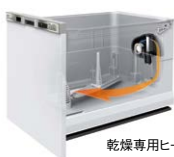
乾燥専用ヒーター搭載!!