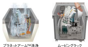
プラネットアーム™洗浄

プラネットアーム洗浄とバイオパワー除菌 ムービングラックで食器セットもラクラク 使用水量8ℓ(標準)で節水 省エネナビで水と電気の無駄を節約