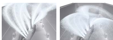
ターボ噴射 スポット(上かごを中心に) ターボ噴射 ワイド(下かごを中心に)