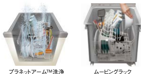
プラネットアーム™洗浄

プラネットアーム洗浄とバイオパワー除菌 ムービングラックで食器セットもラクラク ソフト排気でお子さまにも配慮 使用水量8ℓ(標準)で節水