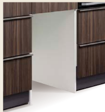
オープンスペース付 調理キャビネット [幅450mm]