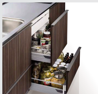
内引出し付台輪2段引出し調理キャビネット [幅900/750/600/450/300mm]