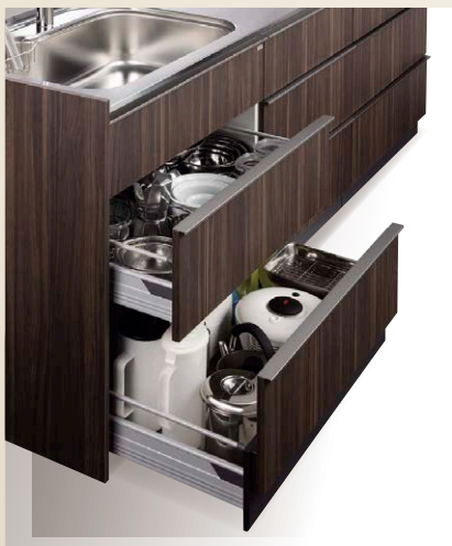
台輪引出しシンクキャビネット [幅1050/900mm]