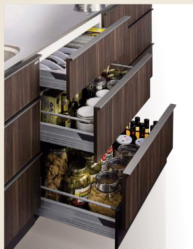
台輪3段引出し調理キャビネット [幅900/750/600/450/300mm]