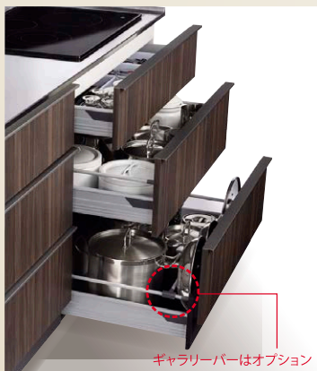
ギャラリバーはオプション