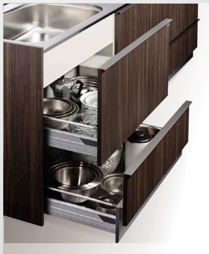
台輪引出しシンクキャビネット [幅1050/900mm]