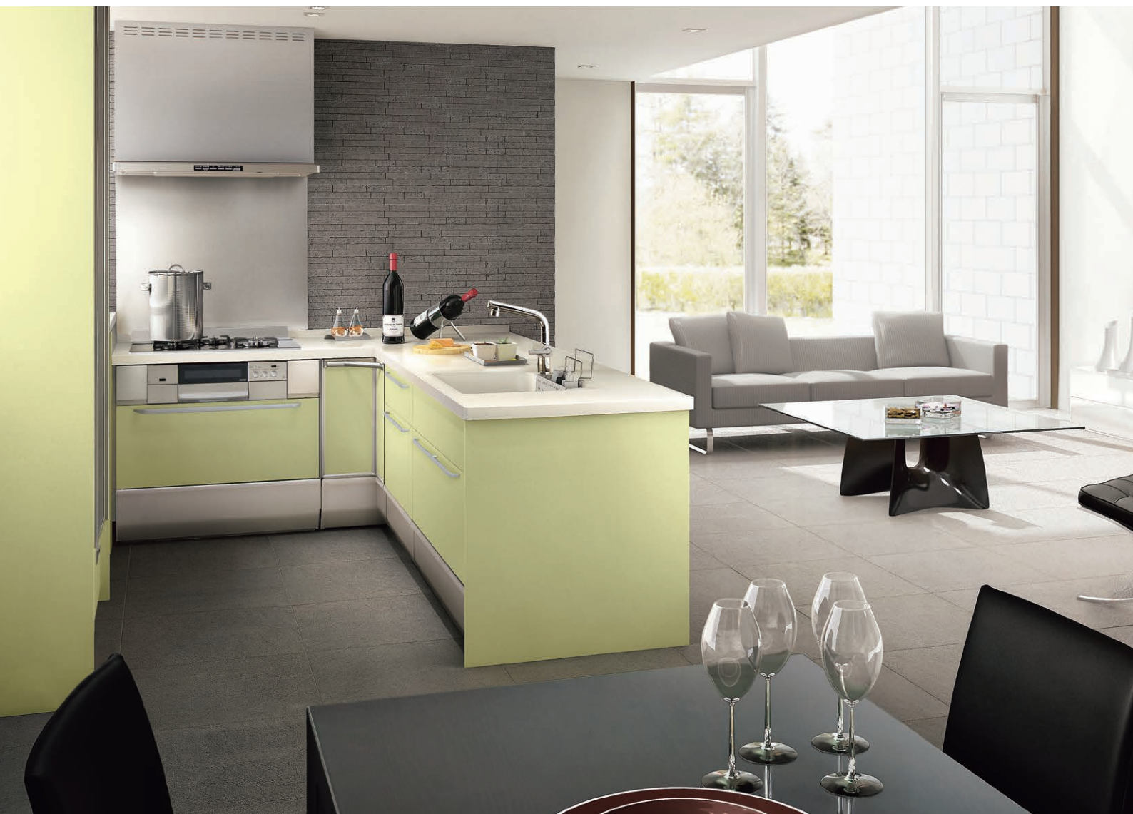
※写真の調理機器は仕様変更となっております。

コンロは壁側に、シンクはリビング側を向いたL型フラット対面。調理中のニオイが室内に流れることも少なく、ゲストや家族との一体感も得られます。