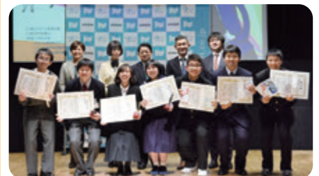
今年1月の決勝大会表彰式の様子

【日程】2019年1月20日(日) 【会場】よみうり大手町ホール(東京都千代田区)