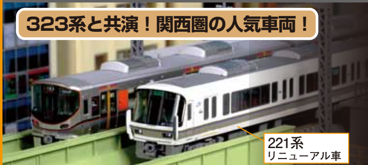
221系 リニューアル車