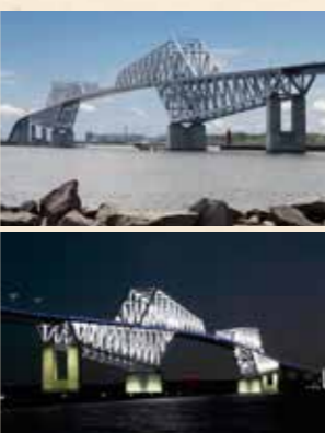
▲美しくライトアップされた夜の姿も見もの

2012年に開通した橋長2,618m、 海面からの高さ最大87.8mの東京ゲ ートブリッジ。東京港や都心を一望で き、東京スカイツリー®と東京タワ ーが一度に眺められます。