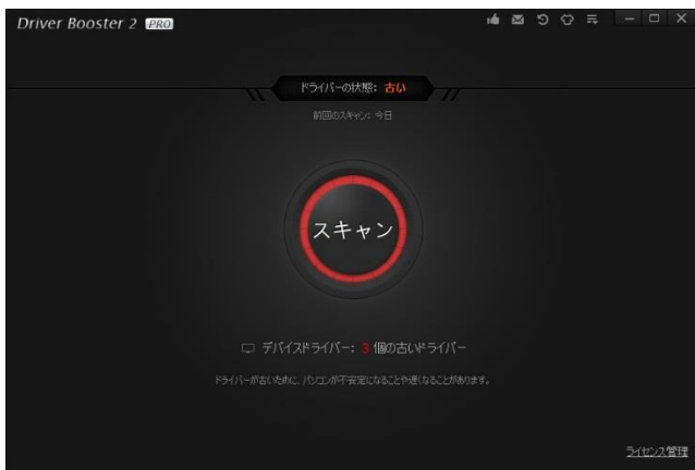
▲メイン画面では、最新の状態を表示します。