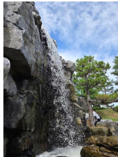
ちゅうごくていえん えんちようえん 中国庭園(燕趙園)