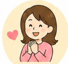
無理なく続けて 再発を防止

健康のために、 大切な人のために。 今こそ、 未来を 変える第一歩 を 踏み出しましょう!