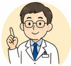
医師による サポート