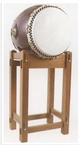
* 太鼓台は別売です