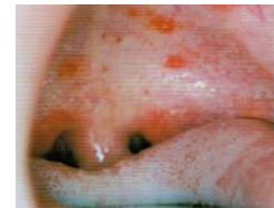
エコーウイルスによる粘膜疹