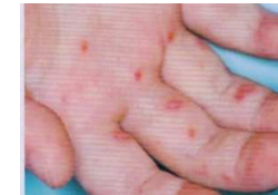
エコーウイルスによる発疹