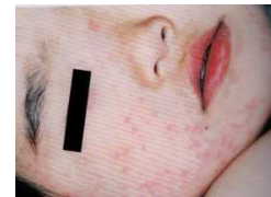
エコーウイルスによる発疹

夏風邪のウイルスによる症状と診断されたら、 発疹が出ていても登園や登校に制限はありません 。熱が下がり、食事がとれるようになれば、体調を見て登園、登校できます。