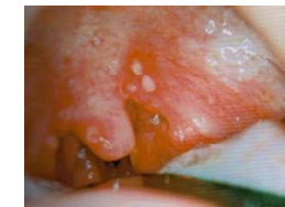
コクサッキーウイルスによる粘膜疹