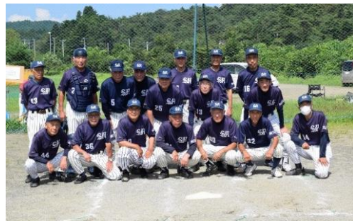
準優勝 仙台北西クラブ