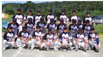
準優勝 多賀城クラブ

第8回大会は、31チーム中21チームのトーナメント大会になった。今回は、新型コロナウイルスの影響で、開催を懸念されたが、無事に終了する事が出来た。