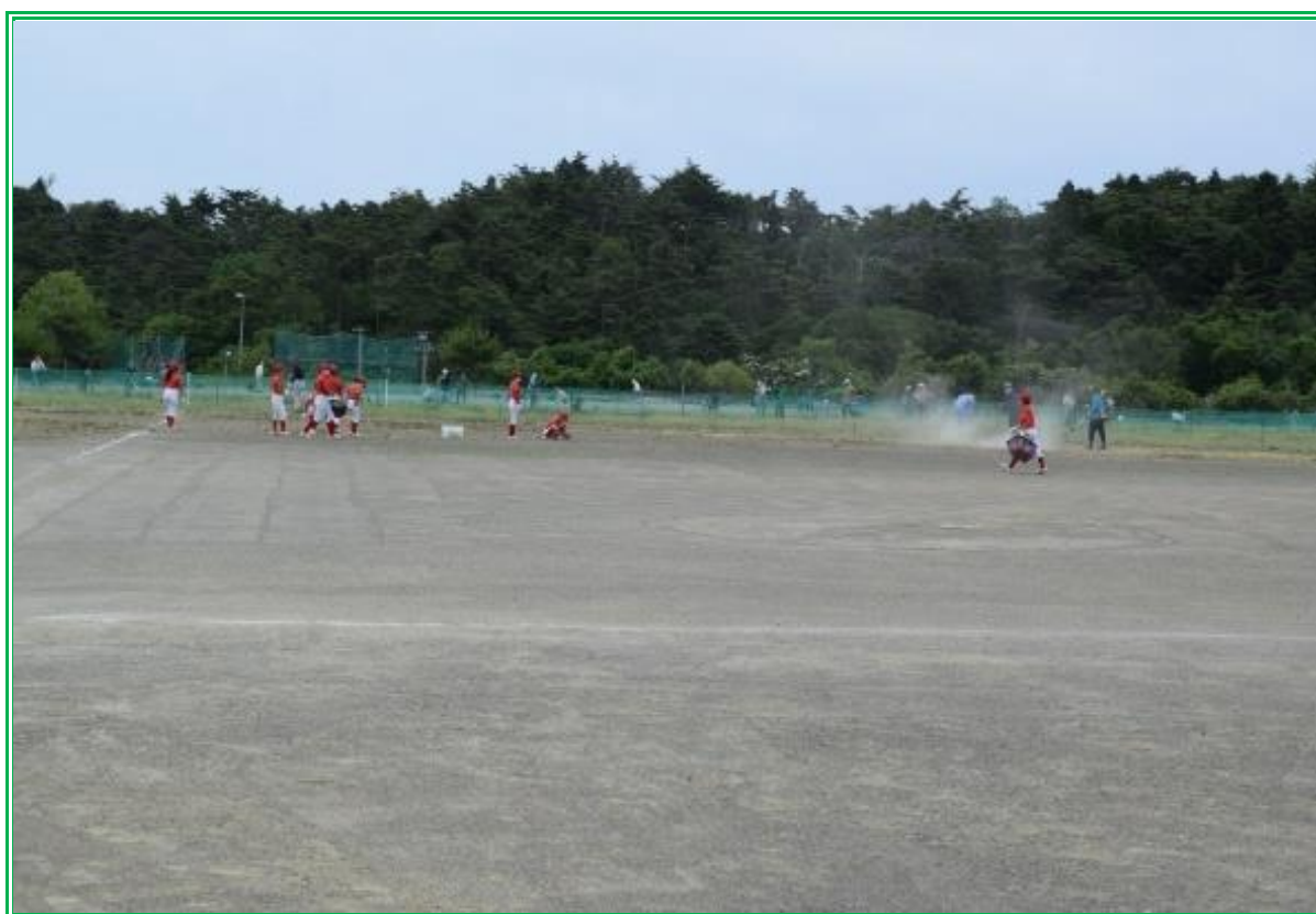
令和2年度、第1回草刈り(シニア連盟・利府レッドスターズ)