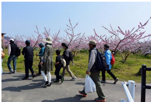
桃の花ウォーキング

特に、夕方からの表彰式にも120名という大勢の参加者があり、より一層の親睦と連帯が深まるなど、初期の目的が達成できました。