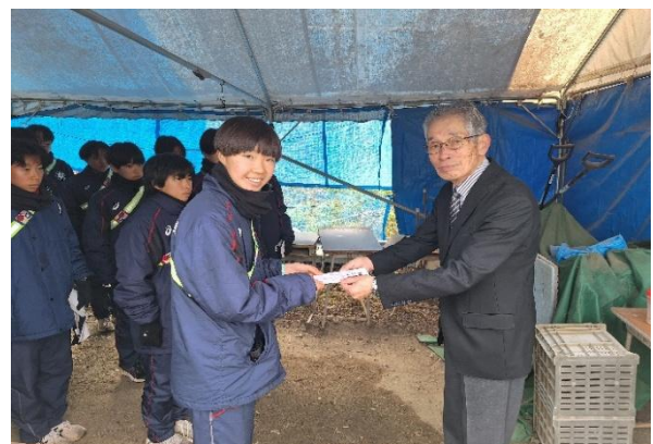
長野東高校女子駅伝チーム 激励金贈呈