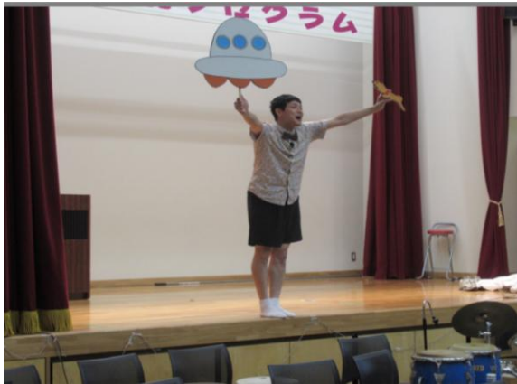
第3回川中島フェスティバル（令和6年）