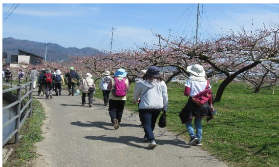
桃ウォーキング(4月)