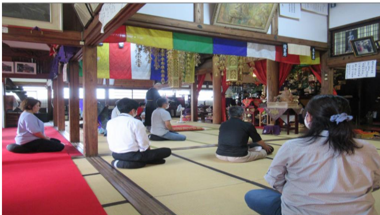
介護者のつどい「常泉寺カフェ」