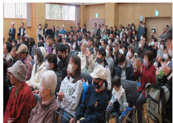
もう中学生ステージ