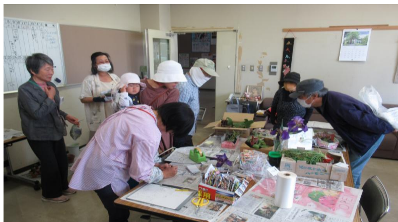
花の種・苗交換会