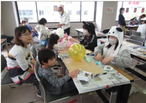
子ども工作コーナー