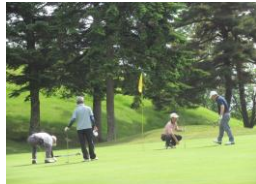
グリーン上での勝負