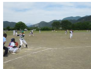
長打を狙って力が入ります