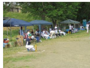
掛け声も一段と大きくなります