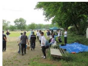
応援団も熱気が上がって きました

5月31日（日）第36回地域公民館対抗ソフトボール大会が開催されました。会場の犀川南運動場には、各地区から17チームの選手が続々と集まり、上位を目指して氣勢を上げていました。昨年は雨天中止となり、今年こそはと早くから練習を重ねてきたチームや、一致団結し素晴らしいチームプレイを発揮する選手たちに拍手が沸き上がっていました。