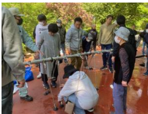
給水管の接続訓練