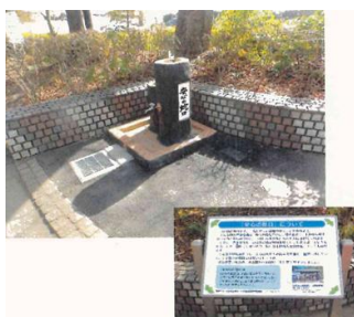
御厨公園南入口に設置された「安心の蛇口」

4月25日(土) 御厨公園において、「安心の蛇口」の組立式応急給水栓接続設備の取扱方法の合同訓練が行われ、御厨区および神田区の関係者、防災指導員、消防団川中島第3分団員など約50名が集まりました。地震などの災害時には12口の蛇口が設置され、威力を発揮することが期待されます。