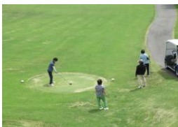
女性陣のティーショット