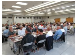
JA平成ホールで表彰式・懇親会が行われました