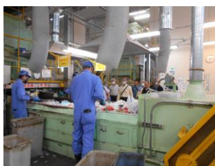
ながの環境エネルギーセンターでの資源分別作業