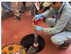
水道管理事務所職員による指導